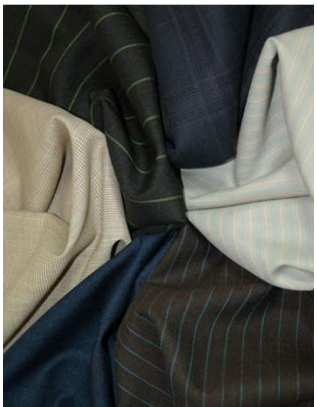
HS 129 SNOWY RIVER - 368000'S

Die Snowy River Region in Australien ist Heimat der Merino Schafherden, die vor über einem Jahrhundert von den ersten Siedlern nach Australien gebracht wurden. Durch sorgsame Aufzucht und eine Diät aus gesundem und frischem Gras, wurden die Erbeigenschaften der Merino Schafe über die Jahre in ein ungeahntes Niveau erhoben und die Schafe produzieren heute erstklassiges Fließ mit außergewöhnlichsten Eigenschaften. Snowy River Stoffe behalten ihre Form und sind wunderbar weich und luxuriös in der Berührung, ein Resultat aus der regelmäßigen Struktur und Wellung jeden einzelnen Haares. Klare, eisige Ströme und blumenreiche hügelige Wiesen kreieren sauberere Lebensräume, was zu einem sauberen, weißen Fließ der Tiere führt, was wiederum effektivste Färbearbeitungen ergibt. Das Ergebnis ist ein Stoff von überlegener Farbqualität und Lichtreflektion. Die gleichmäßigen Fasern bieten gesteigerten Komfort und zusätzlich zu dem wunderbaren Erscheinungsbild der Stoffe garantieren sie, dass das Kleidungsstück seine Form dauerhaft beibehält.