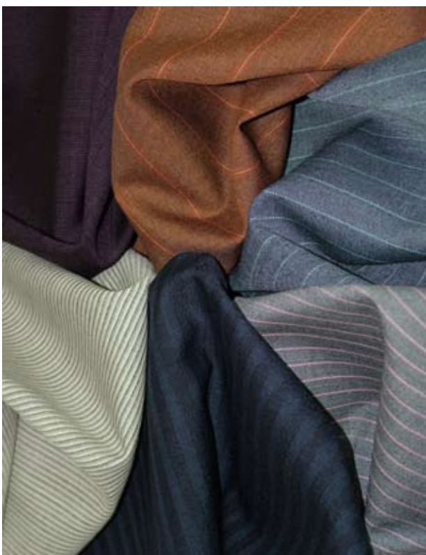
HS 119 ENGLISH MOHAIRS - 288000'S